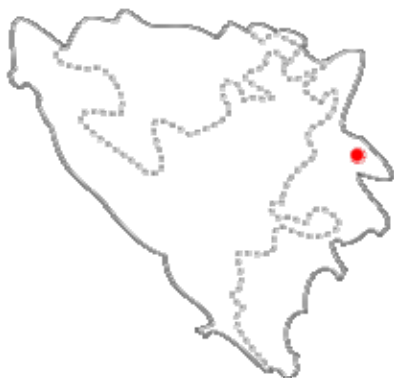
Posizione del villaggio di Sučeska – comune di Srebrenica

Almeno 1.150 persone del villaggio di Sučeska sono state uccise durante la guerra, specialmente nei giorni del massacro o durante la fuga disperata a piedi verso Tuzla. Al termine della guerra i primi profughi che hanno avuto il coraggio di rientrare hanno trovato il villaggio completamente raso al suolo. Coloro che non sono fuggiti all'estero, o in altre parti dell'ex territorio jugoslavo, hanno trascorso gli anni successivi il conflitto in campi profughi in condizioni estremamente precarie, ma comunque sotto la tutela internazionale, che ha fornito loro alcuni aiuti sanitari e materiali.